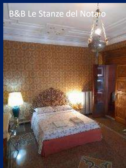
B&B Le Stanze del Notaio

Contattaci a info@centurini.it per servizio prenotazioni